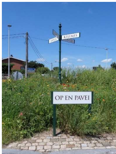
Wegwijzer in het Platdiets langs de Luikse Steenweg (Op en Pavei) in het gehucht Birken.

Het aantal gebruikers van het Platdiets neemt sinds de nieuwe wetten van 1962 gestaag af. Onder inwoners jonger dan 35 jaar wordt deze taal haast niet meer