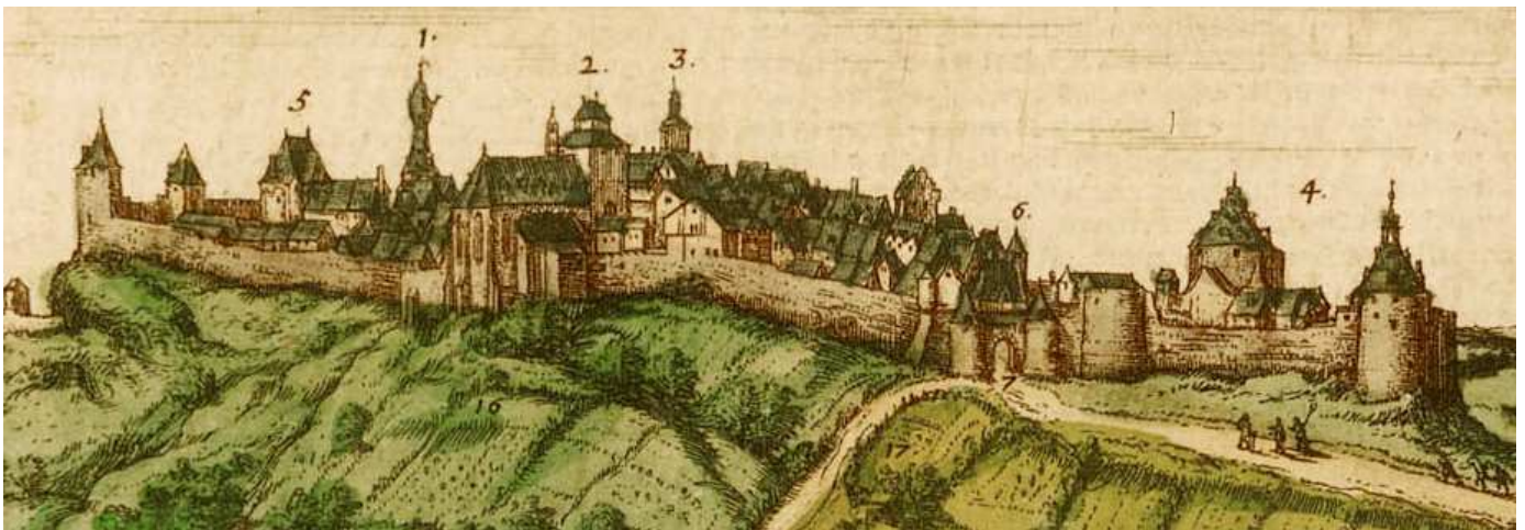
Hoofdstad van het hertogdom Limburg, Limburg aan de Vesder. (Stedenatlas van Hoogenberg & Braun, 1572-1618)

Daarom werd deze naam nu toegekend aan het