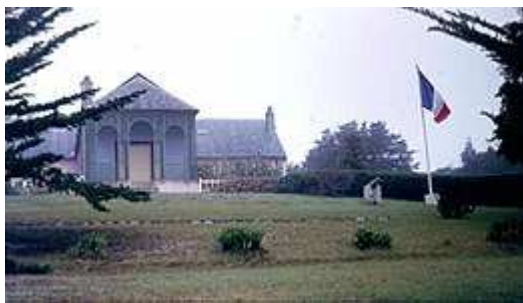
Longwood House nu museum

Daarvoor moeten we terug naar de Slag bij Waterloo op 18 juni 1815 en de definitieve nederlaag van Napoleon Bonaparte. Bonaparte werd gestationeerd op Sint Helena (eiland Atlantische Oceaan) waar hij vanaf 15 oktober 1815 tot zijn dood op 5 mei 1821 verbleef in Longwood House (nu museum).