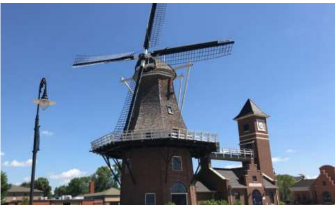
Little Chute Wisconsin

Voor het evenwicht (t.o. bovenstaand) in de Brabantse activiteiten: even naar Noordoost Brabant. Een grote groep katholieke Brabanders emigreert van 1848 tot 1960 naar het dorpje Little Chute (Wisconsin) in de Verenigde Staten.