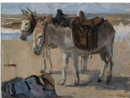
Afbeelding van Israëls

Dit initiatief is een gevolg van een samenwerkingsafpraak van het Rijksmuseum en vijf stadsmusea in Nederland voor acht jaar. Met een specifiek onderwerp: de vier elementen aarde, water, lucht en vuur zullen centraal staan.