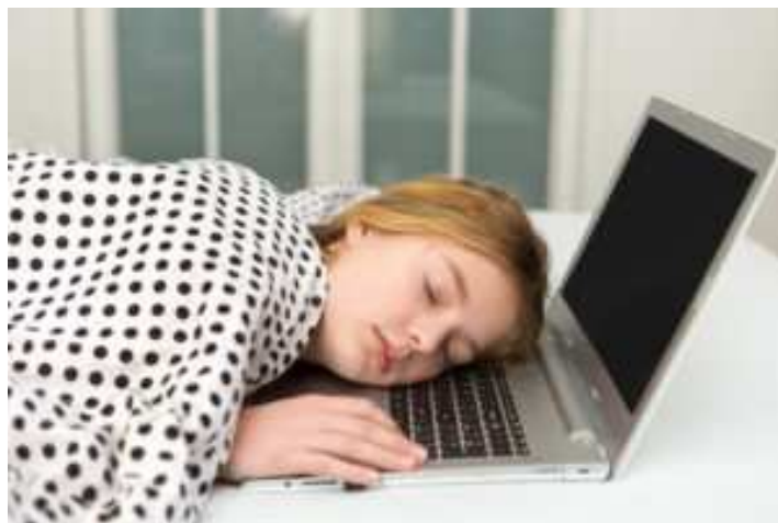
Onderzoek onder 50.000 Duitse patiënten

neurologische klachten die vrij vaak tot de dood leidden.