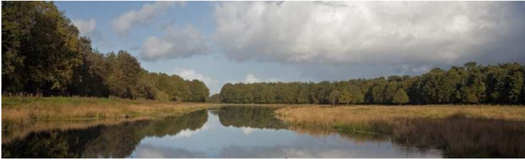
Ontdek de natuur: Pannenhoef

andere functie. Ontveende gronden werden beplant en werden bossen of landgoederen.