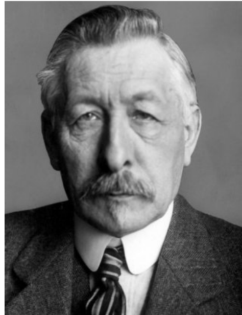
Mr. P.J. (Pieter Jelles) Troelstra 1860-1930

Voor in Duitsland waren er tegen het einde van de oorlog muiterijen onder de militairen die rond de vredesonderhandelingen in opstanden en publieke wanorde eindigden. Dit had ook invloed op het bestuurlijk Nederland omdat het de onrust kon aanjagen. In Nederland probeerde Troelstra gebruik te maken van de onvrede in het leger, maar zijn oproep tot een revolutie verzandde spoedig. Ook al omdat Troelstra weinig persoonlijke moed toonde.