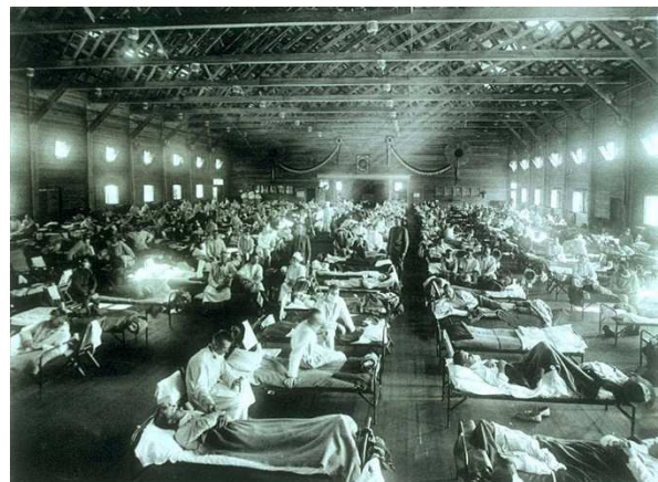
The Spanish Influenza. Emergency military hospital during influenza epidemic, Camp Funston, Kansas, United States

Het begin van de Spaanse griep was in de VS. In 1917 besloot de VS zich bij de geallieerden bij de strijd tegen Duitsland aan te sluiten. Op korte tijd wist men een grote legermacht op de been te brengen, die her en der in kampen werden gelegerd. Als men niet oplet: een ideale omstandigheid voor epidemieën die zich snel kunnen verspreiden. In de Verenigde Staten werd de ziekte voor het eerst in januari 1918 in Camp Funston in Haskell County, Kansas, geconstateerd. De legerarts meldde dit en waarschuwde voor de gevolgen. Van Funston sloeg de griep over naar andere kampen.