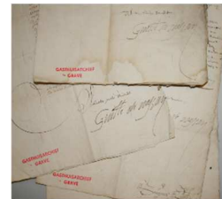
Brieven met handtekening van Willem van Oranje

Hiervóór al waren het 'Zeeuws Archief in Middelburg' en 'Art in Print' geselecteerd. Op 12 augustus is de digitale inventaris met de scans van alle documenten officieel geopend. Je vindt het via de website van het BHIC: www.bhic.nl/catharinagasthuis