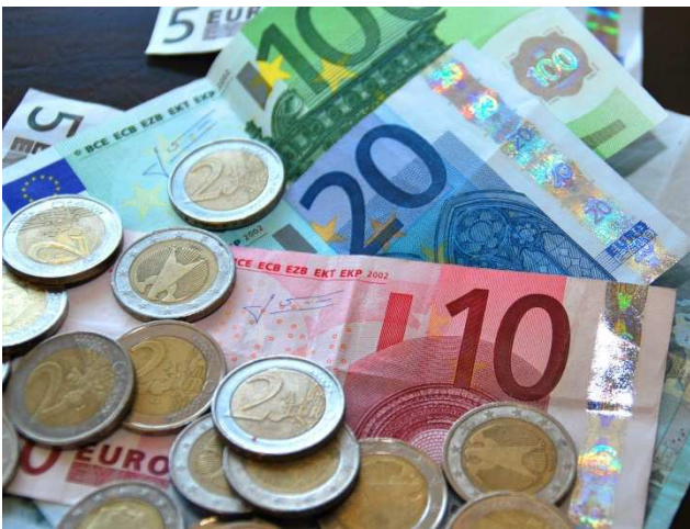
Het mag ook ietsje meer zijn . . . (animatie)

De leden die niet aan hun lidmaatschapsverplichting hebben voldaan, hebben tot 1 maart de tijd.