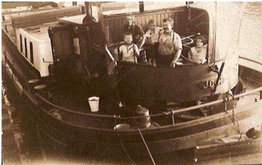
Het schip werd gebouwd in 1916/1917 op de werf van H. Boot & zonen in Vrijenban, dat in 1921 deel van Delft werd. (website)

Was het hele gezin aan boord, dan was ook letterlijk en figuurlijk het huis te klein. De laatste generatie schippers, broers van de inleider, ging dan ook aan wal toen hun kinderen naar school moesten. Daarmee kwam tevens een eind aan 500 jaar schippersfamilie.