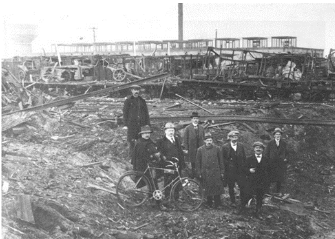
Notabelen uit Hamont en Budel op bezoek in het rampgebied na de treinontploffing op 18-11-1918