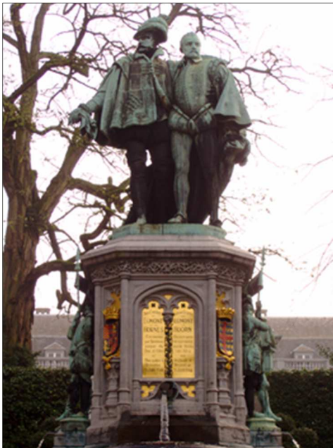
Egmont en Horne in Brussel

Opstandigheid tegen Filips II van Spanje bracht hem, samen met Lamoraal I, graaf van Egmont, in Brussel op het schavot, waar ze 'in delen' van af kwamen. Zoiets levert natuurlijk een standbeeld op.